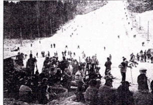
Korvgöring hör lika mycket till som själva åkningen, under en dag i skidbacken.