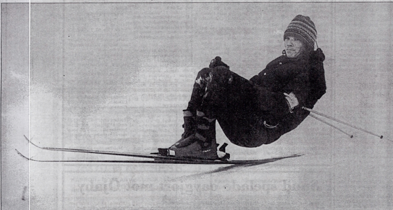
Petter Karlsson text o foto